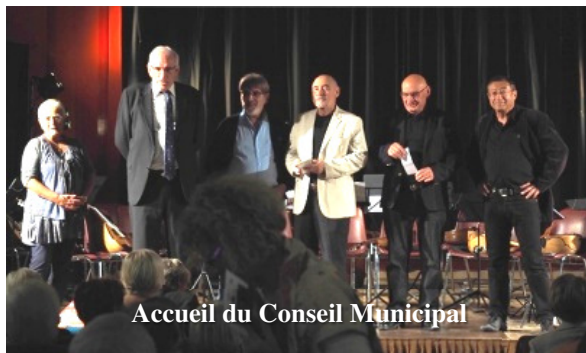
Accueil du Conseil Municipal